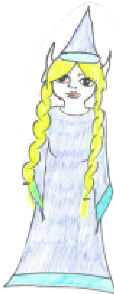
mynd 5 álfadrottning