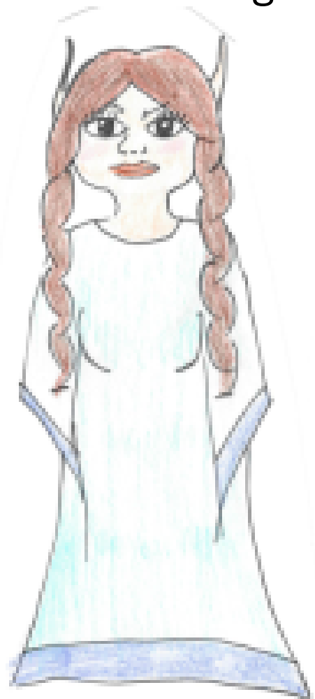
myndir 6 : álfar