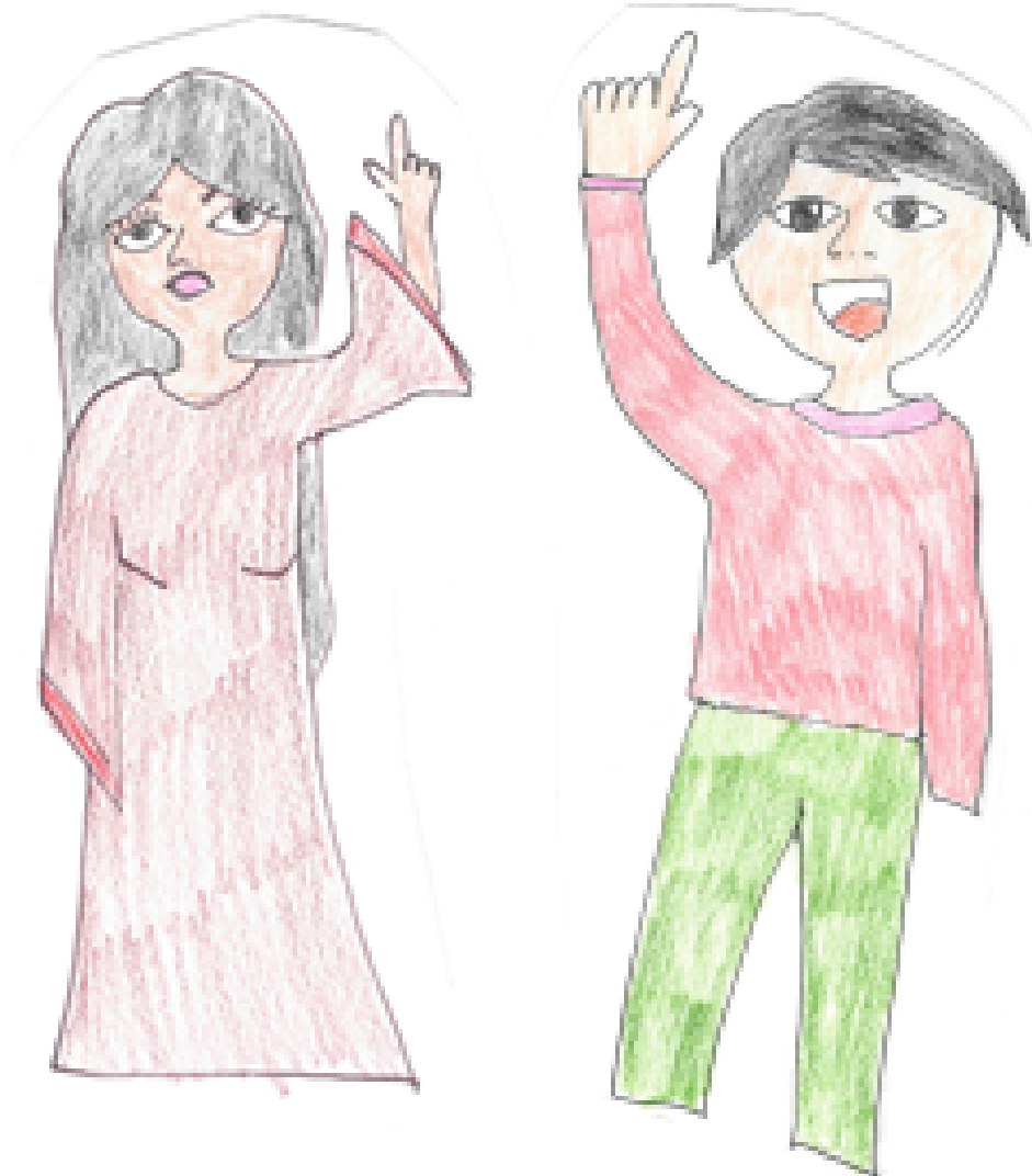
myndir 8 : systkini