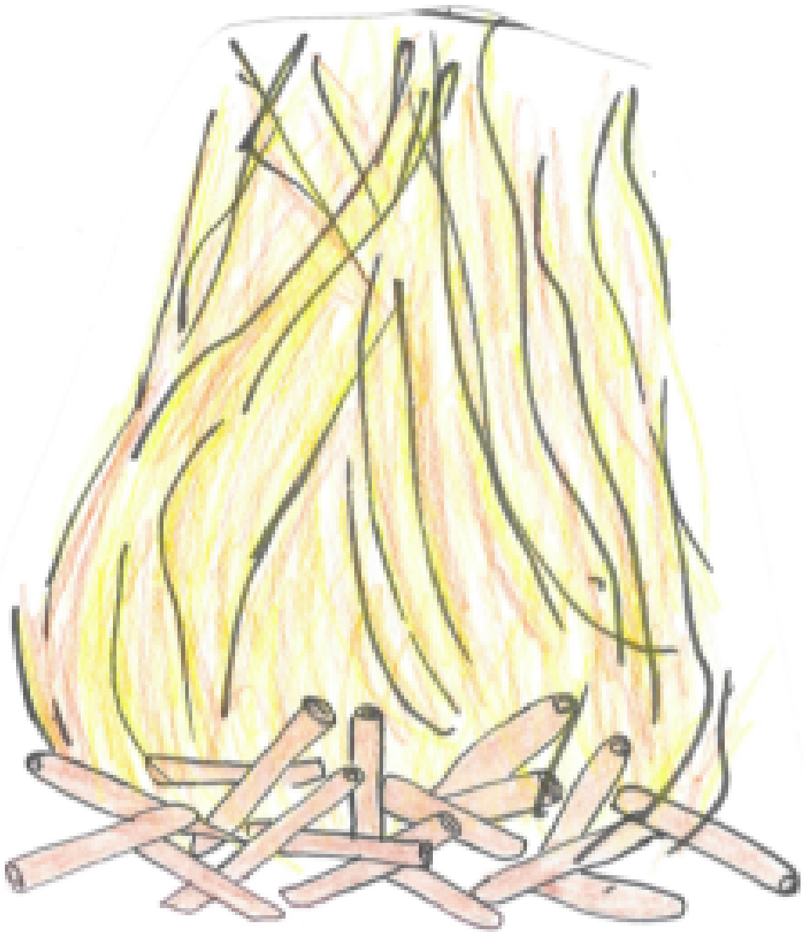
mynd 4 : varðeldur