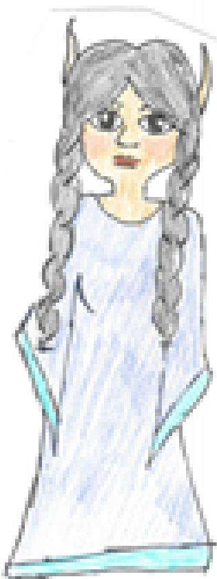
mynd3 : fyrsta systir